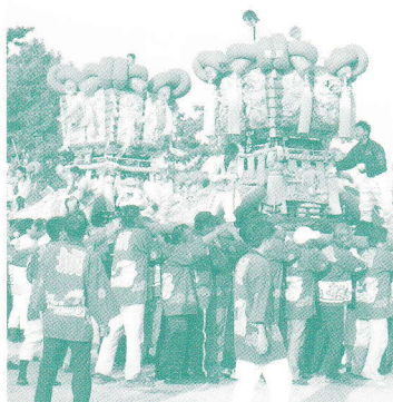
さぬき豊浜ちょうさ祭